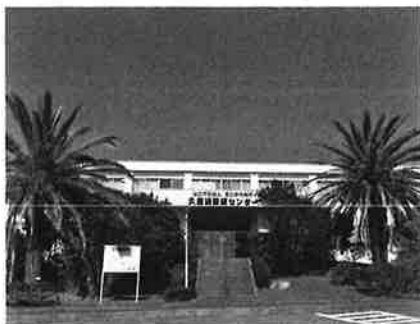
久里浜医療センターの風景

インターネットやオンラインゲーム、SNS、スマートフォンなどの急速な普及に伴い、世界的にいわゆるネット依存の問題が深刻化しています。韓国や中国では、長時間オンラインゲームをプレイし続けて死亡するといった事故も報告され