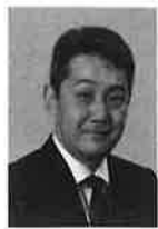
久里浜医療センター 精神科診療部長

東北大学医学部卒業後、国立療養所久里浜病院にてアルコール依存症の診療に従事し、2011年より現職。国際アルコール医学生物学会前理事長。