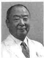
久里浜医療センター 院長