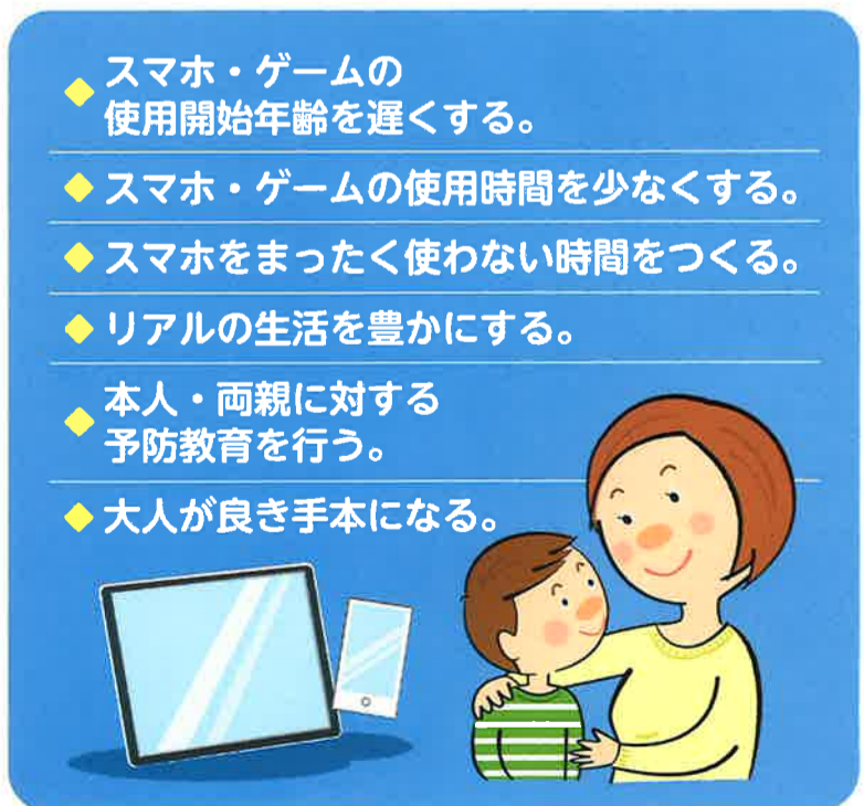
表2 今できる予防対策

リスク要因から考えると、表2のような予防対策が有効ではないでしょうか。予防教育に加えて、幼少時からのオンライン以外の楽しい活動の経験は予防につながります。大人が子どもたちに対して、スマホの使い方などの良きお手本を示すことも重要でしょう。