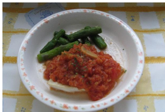
めかじきソテー トマトソースがけ

魚料理は和風の味付けが多かったため、トマトソースで洋風の味付けのメニューを考えました。