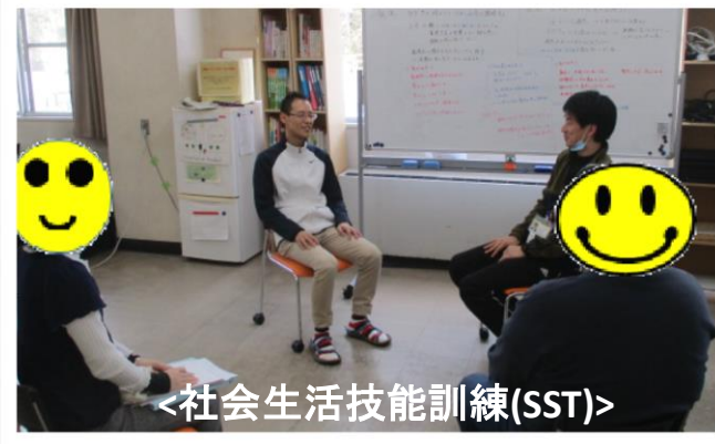
<社会生活技能訓練(SST)>